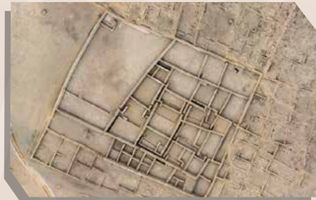
Archivo Ministerio de Cultura

Está conformada por varios conjuntos arquitectónicos. Destaca el sector llamado "El Laberinto" en el Conjunto Sestieri. Fue construido alrededor del año 600 d.C. Se ubica en Lurigancho - Chosica, cerca a la avenida Cajamarquilla, al lado de los poblados de La Campiña y Santa Cruz.