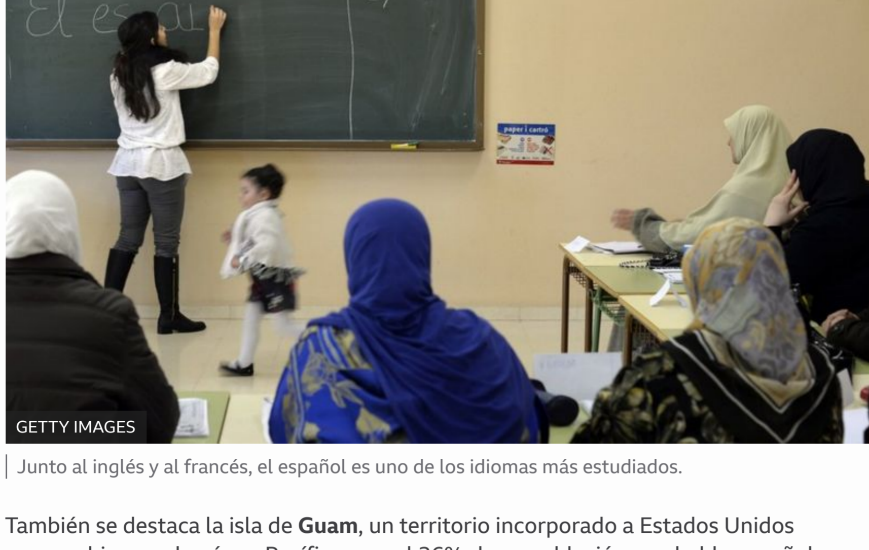
Junto al inglés y al francés, el español es uno de los idiomas más estudiados.

En las Antillas Holandesas , en el Caribe, el 59% de sus habitantes habla español y en Belize , América Central, lo hace el 52%.