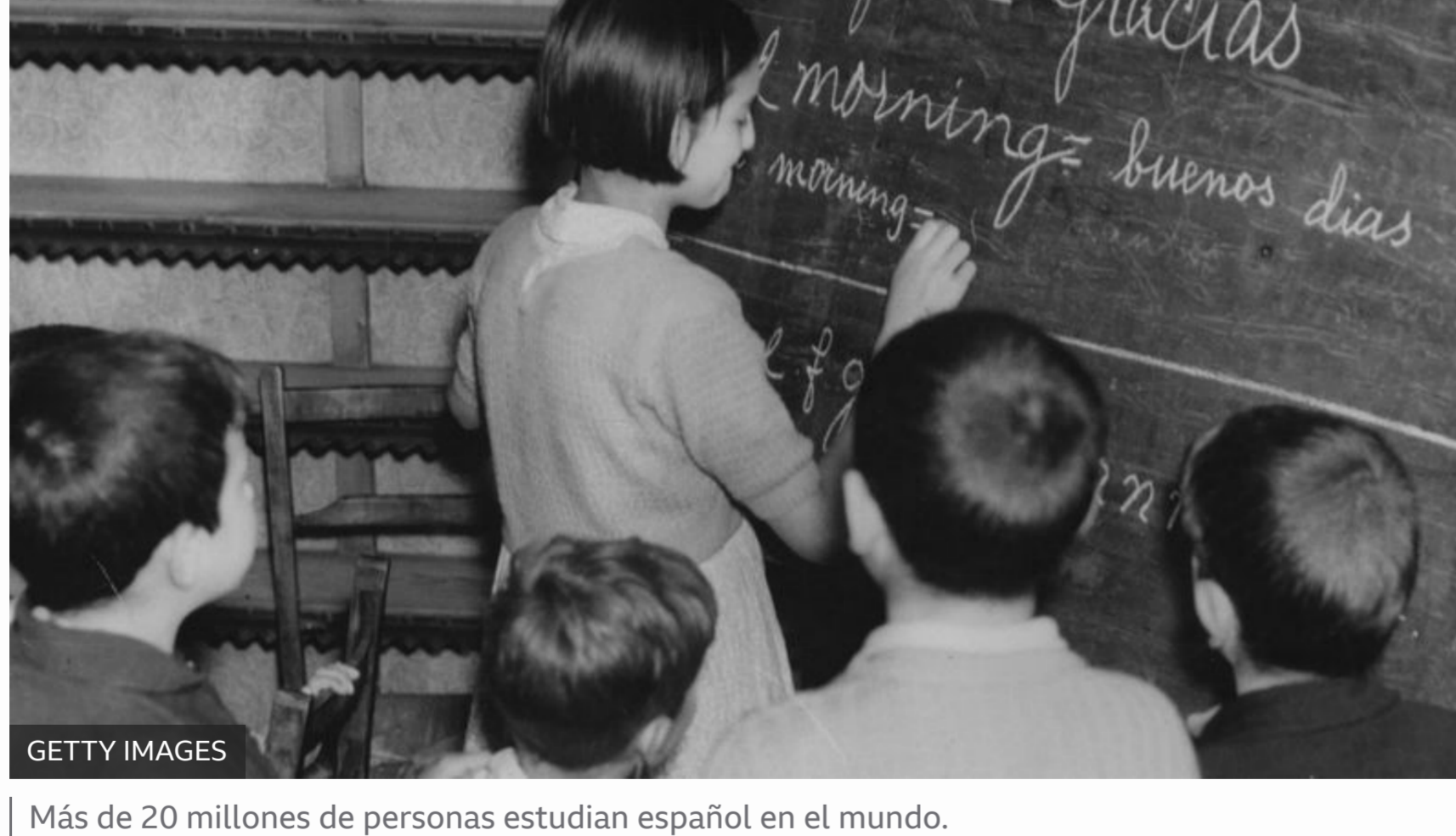
Más de 20 millones de personas estudian español en el mundo.

El inglés, el francés, el español y el alemán , en este orden, son los idiomas más estudiados, como lengua extranjera según el primer informe Berlitz sobre el estudio del español en el mundo, elaborado en el año 2005.