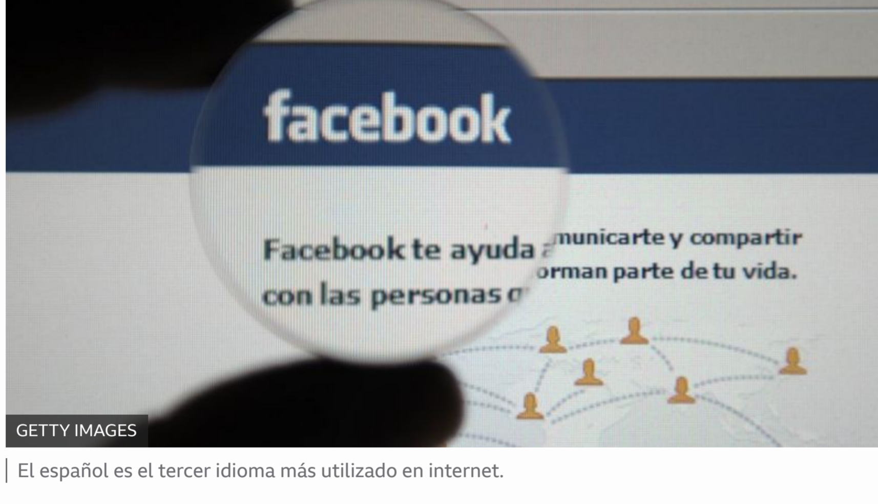
El español es el tercer idioma más utilizado en internet.

El español es la segunda lengua materna del mundo por número de hablantes , tras el chino mandarín, con mil millones de hablantes.