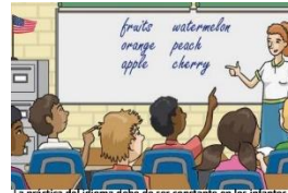
La práctica del idioma debe de ser constante en los infantes, para que su léxico aumente cada día más y pueda expresarse de una manera adecuada con la lengua inglesa.