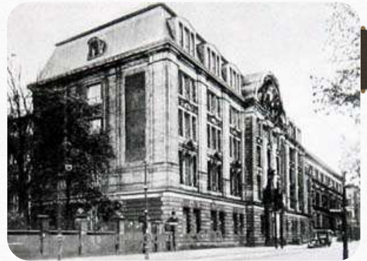
Escuela de Frankfurt

La pedagogía crítica (1980) ha venido construyéndose y conquistando cada vez más interés entre los profesores. Esta corriente pedagógica se nutre principalmente de los estudios de la Escuela de Frankfurt, de Antonio Gramsci y de Jürgen Habermas.